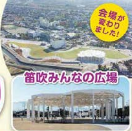
会場が 変わりました!

5/3(水) 10:00▶17:00・5/4(木) 10:00▶15:30 小雨決行