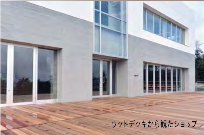
ウッドデッキから見たショップ