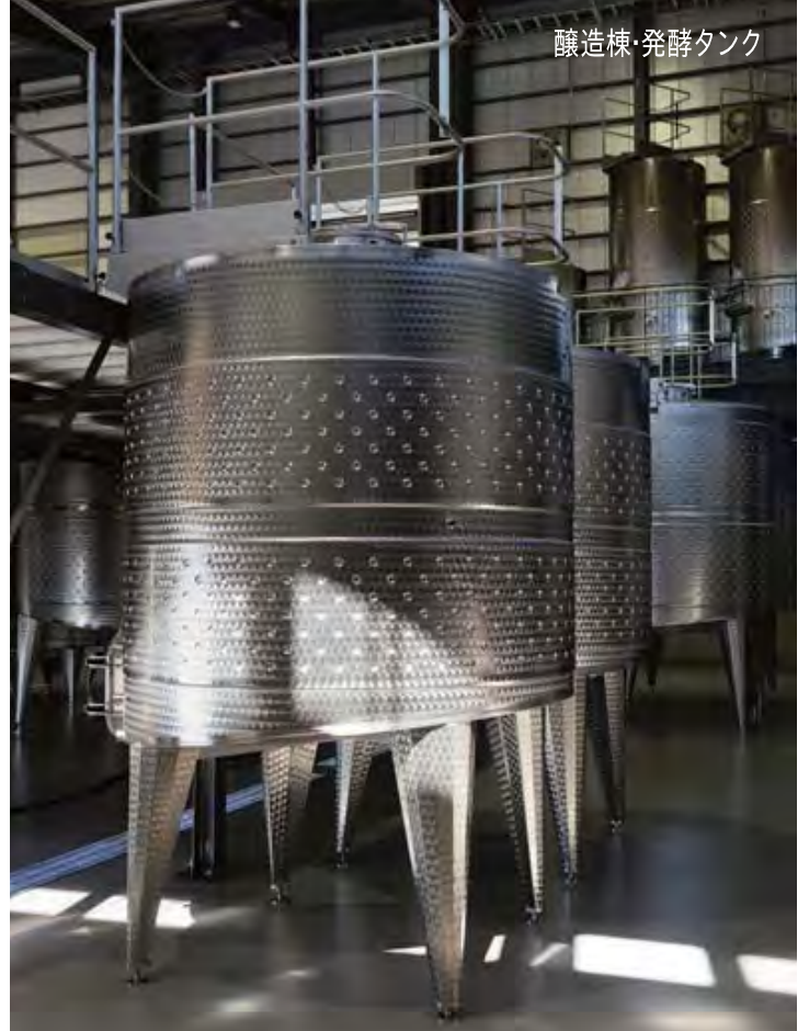
醸造棟・発酵タンク