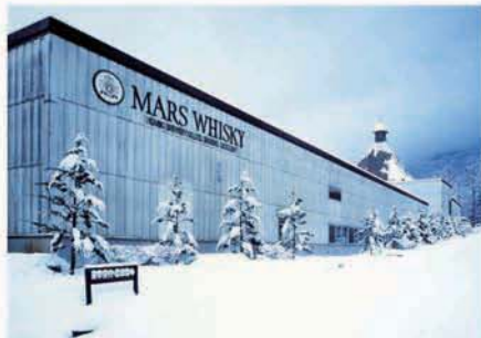
積雪で覆われた信州ファクトリー

「IWAI TRADITION」を生み出した信州ファクトリーは、信州中央アルプス駒ヶ岳山麓標高798mに立地し、空気は澄み、霧深く、冷涼で、花崗岩質土壌地下120mから出る美味しい水にも恵まれており、まさにウイスキー造りの理想郷と言えます。この商品の根幹にはこの環境が造り出した味わいが脈々と生きており、しっかりしたボディと上品で熟成感ある口当たりが特徴です。