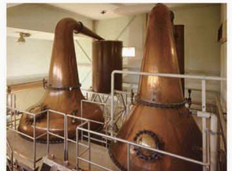
信州ファクトリー・ポットスティル (ストレートヘッド型)

「IWAI TRADITION」を生み出した信州ファクトリーは、信州中央アルプス駒ヶ岳山麓標高798mに立地し、空気は澄み、霧深く、冷涼で、花崗岩質土壌地下120mから出る美味しい水にも恵まれており、まさにウイスキー造りの理想郷と言えます。この商品の根幹にはこの環境が造り出した味わいが脈々と生きており、しっかりしたボディと上品で熟成感ある口当たりが特徴です。